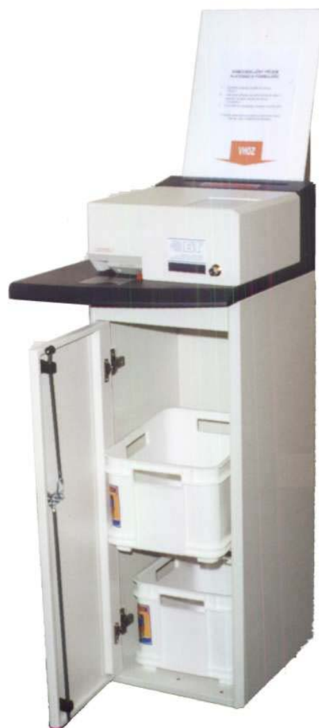
Odkládací prostor s přeprawkami