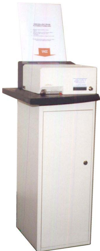
Celkový pohled (model 756)

Zařízení umožňují další zvýšení komfortu obsluhy klientů a racionalizace práce v bankách včetně rozšíření nabídky na př. v samoobslužných zónách.