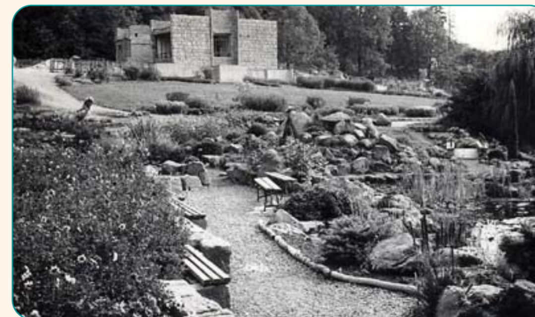
Pohled na část rozestavěné plochy arboreta (1983)