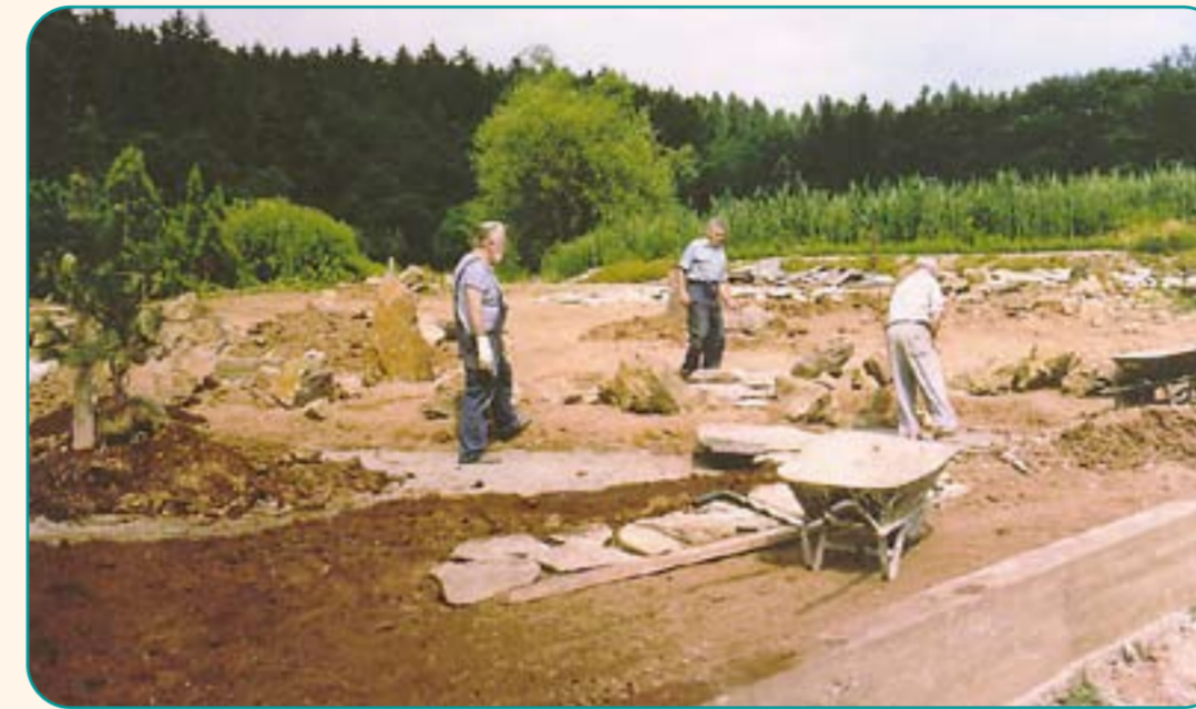
Budování japonské zahrady (1984)

Společenstvo skládek, lomů, naspů dopravních cest - jedná se o místa neobdělávaná, porostlá divokou rumištní vegetací. Některá tato místa člověk kontroluje a užívá - např. násypy a příkopy silnic a železnic, skládky.