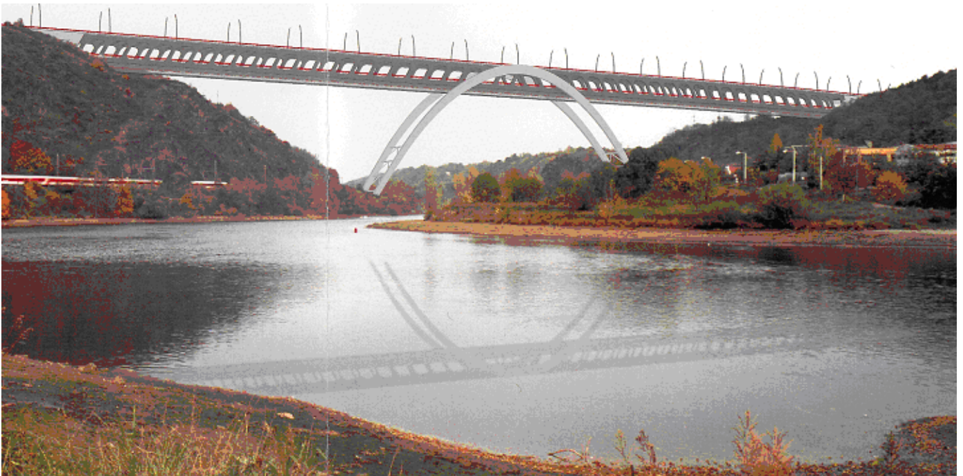
Most, po dimenzování na požadovaná zatížení a prostorové nároky - dokumentace DÚR - říjen 2004